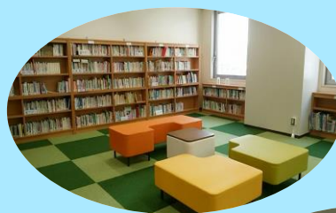
図書・情報スペース

図書・情報スペース では、自分らしく生きる、生きづらさを乗り越えるヒントや、ジェンダーについての学びを得られる本、コミックなどを揃えています。1人3冊、2週間まで 貸し出し出来ます。